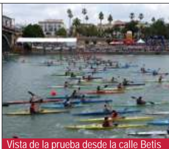
Vista de la prueba desde la calle Betis

En esta vigésima edición han participado más de 30 clubes procedentes de toda España con más 450 embarcaciones en competición.